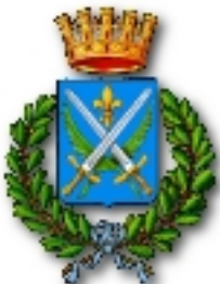
Comune di Sondrio